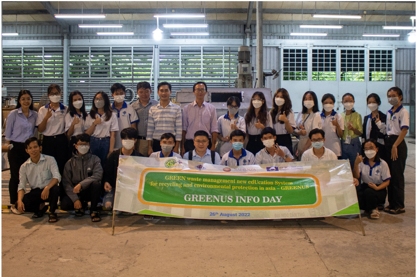
Lab visit #2: Students experienced the compost making equipment