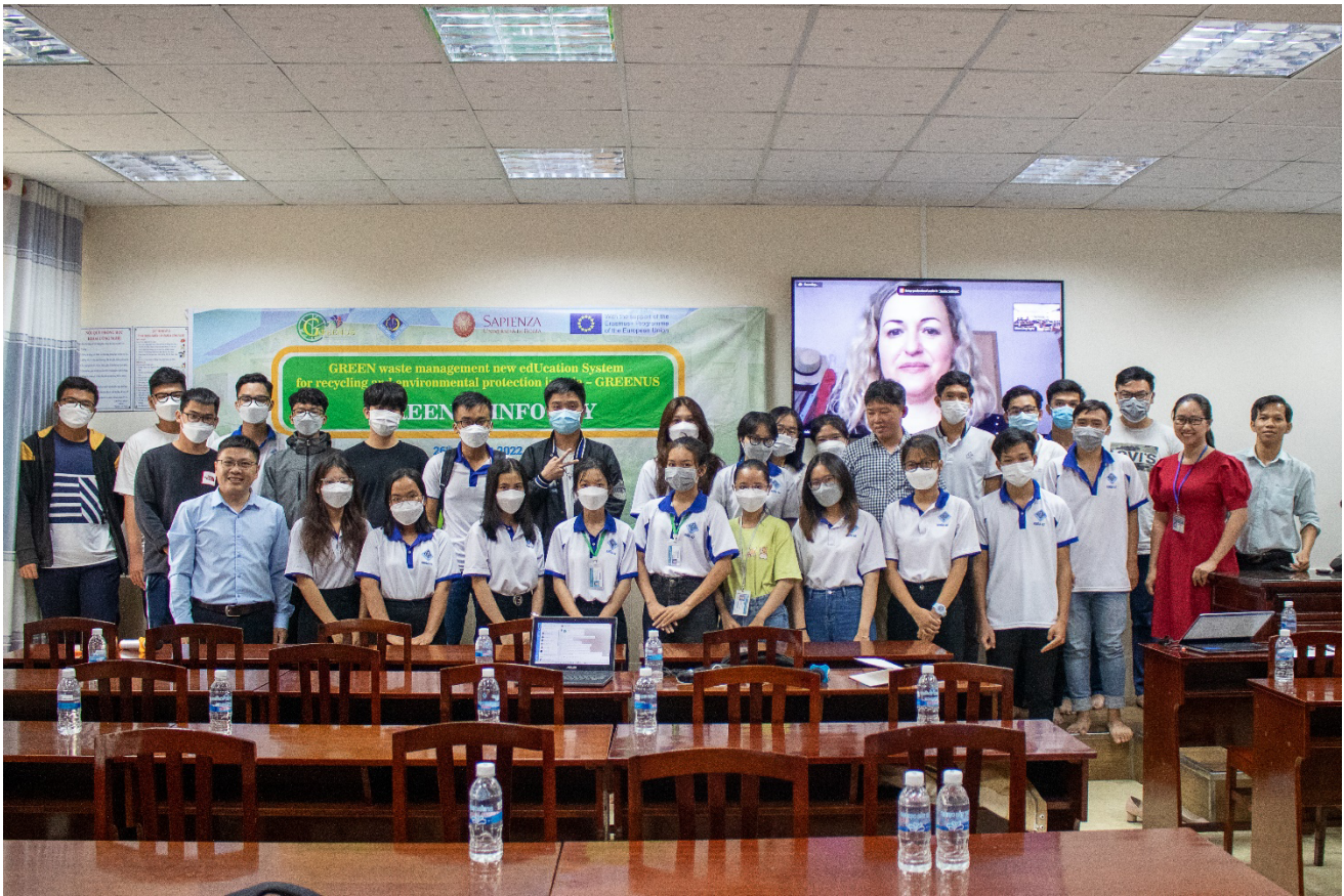
Group photos of the participants.