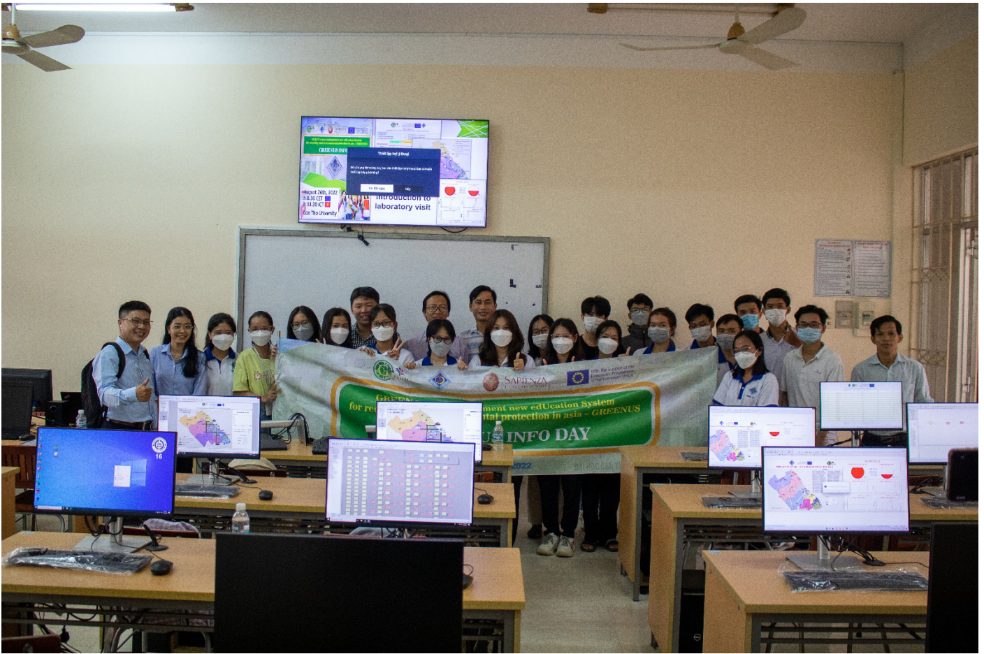
Lab visit #1: Students experienced the software developed by GREENUS.