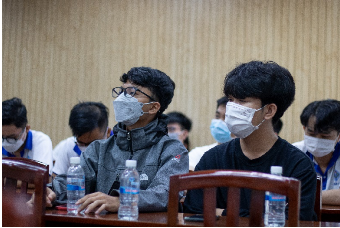
The CTU's Action Team presented the ECOCAMPUS Action plan.